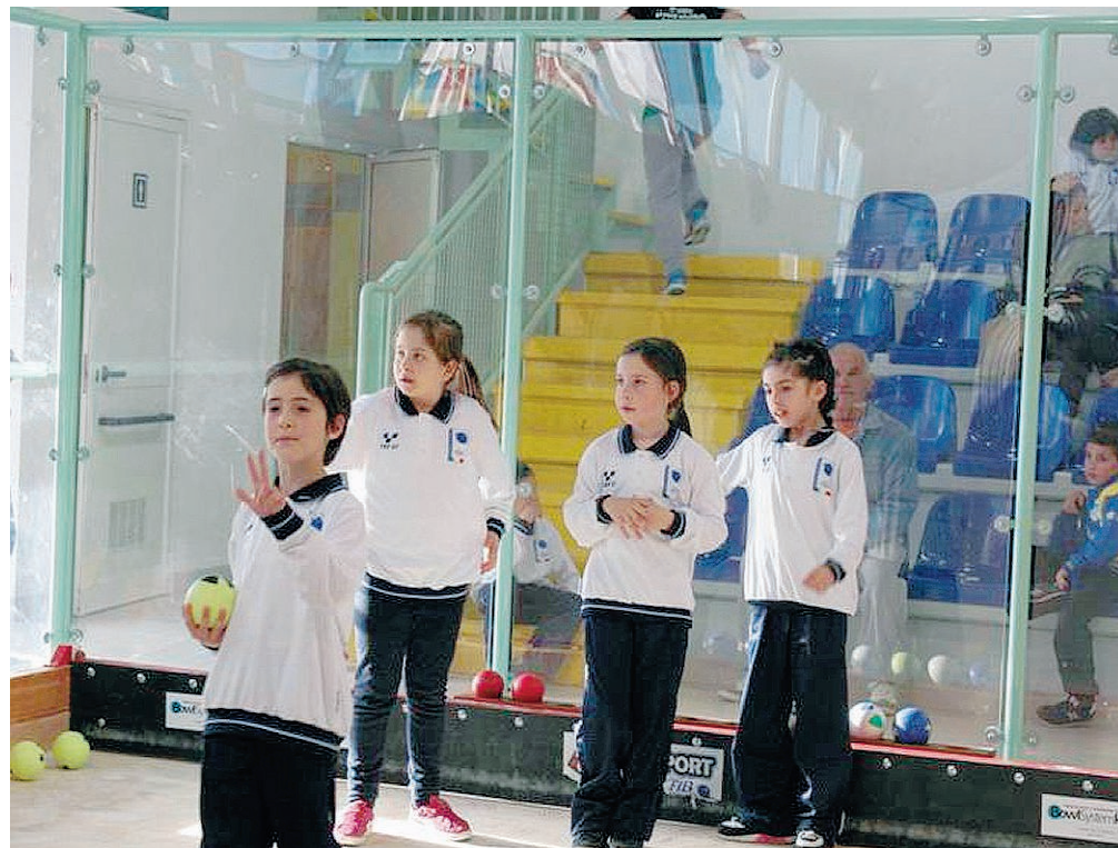
■ La squadra esordiente femminile Valentino Baccini