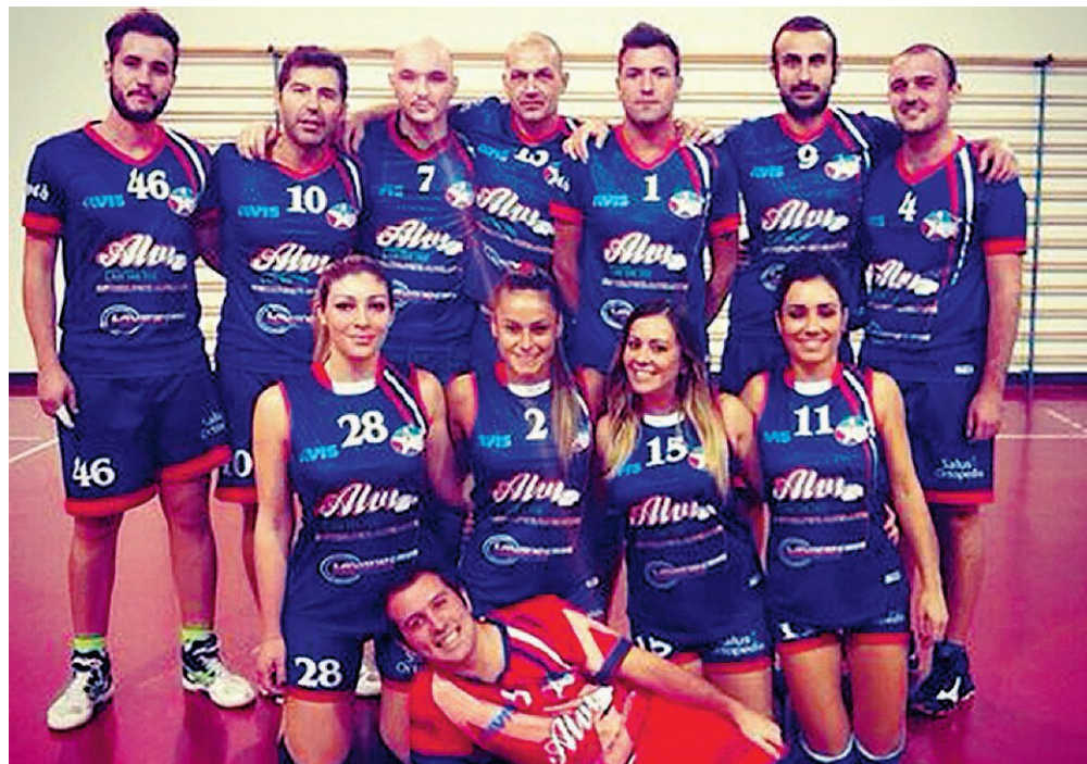
La capolista AlviHydravolley Bracciofonico